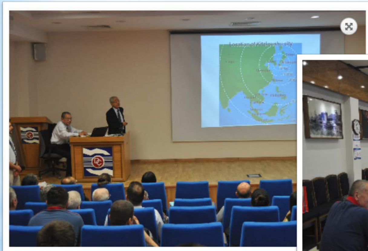
北九州とKITA組織の紹介