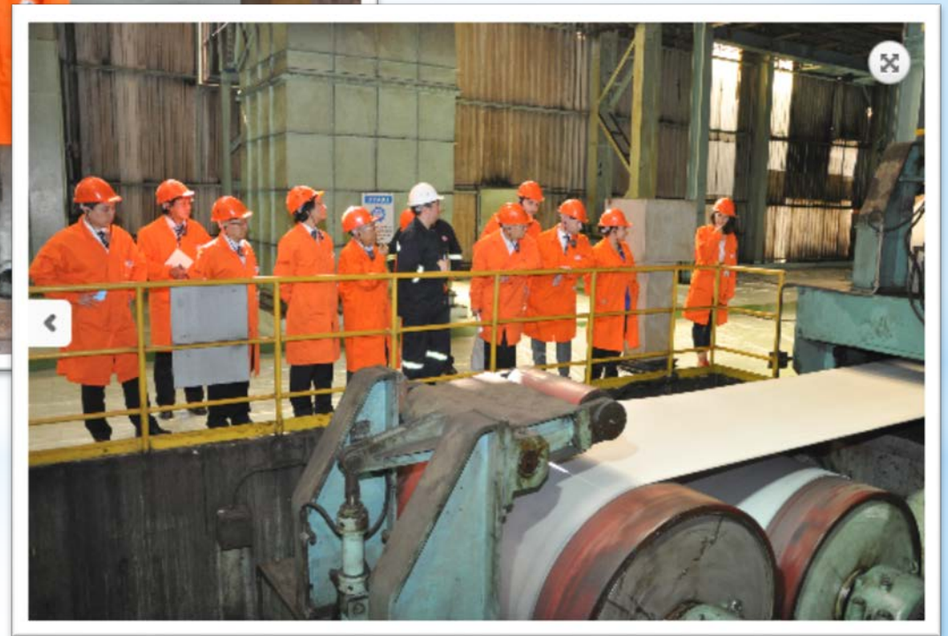
エルデミール製鉄所の工場見学