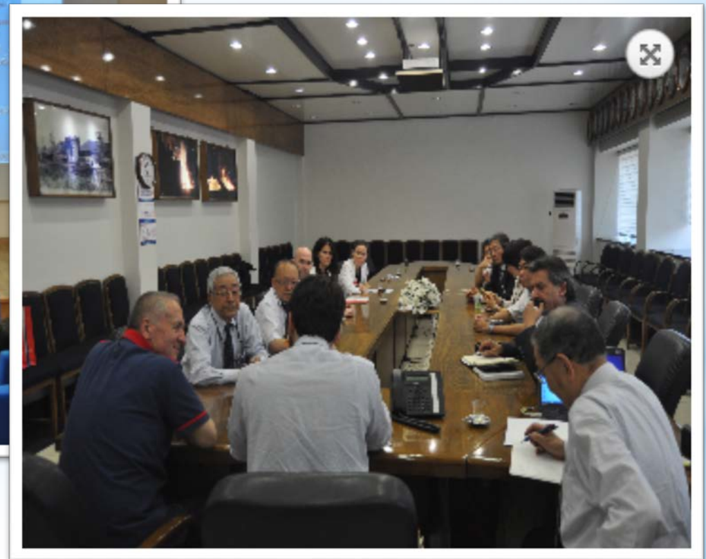
カルデミール製鉄所と会談