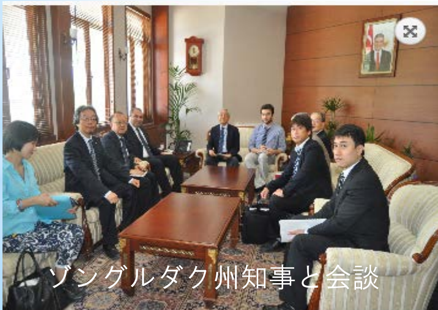
ゾングルダク州知事と会談

2014年6月18日にゾングルダク州知事（兼エルデミール役員）を表敬訪問し、今回の事前調査の趣旨および今後の両地域の産業交流の支援を要請。