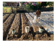
図5 堆肥を使った試験栽培