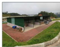
図3 コンポストセンター