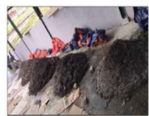
図4 出来上がった堆肥