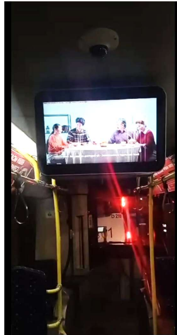
カラガンダ市の鉄道駅での啓発ビデオ放送 アスタナ市内バス車内での啓発ビデオ放送