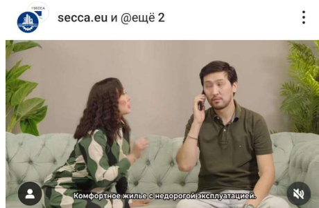
啓発ビデオ動画のひとコマ