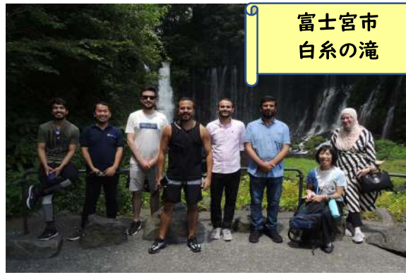
富士宮市 白糸の滝