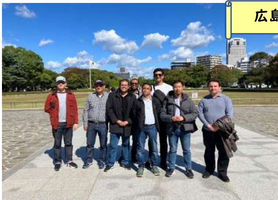
広島 平和記念公園