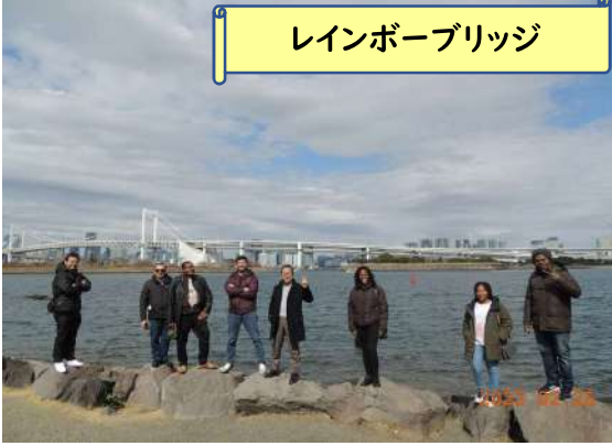
レインボーブリッジ