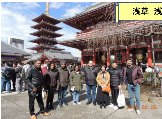
浅草 浅草寺&五重塔